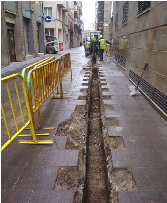
Foto 1. Rasa al c/ De Solà núm 2-6.