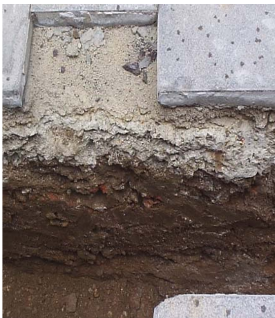
Foto 3. Seqüència estratigràfica.