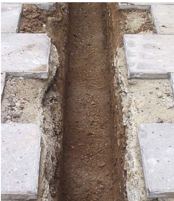
Foto 2. Tram de la rasa ja rebaixada totalment.